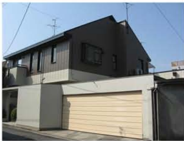
工 事 後 写 真