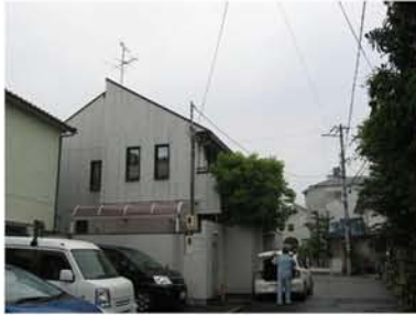
工 事 前 写 真